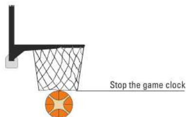
Figura 1 - Un canestro è realizzato